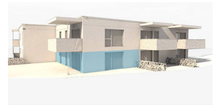
lage im gebäude